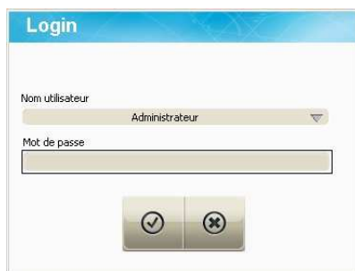
Configuration (accès sécurisés)