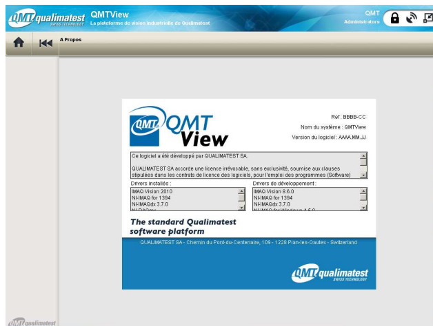
Interface standard QMTView (menu principal)